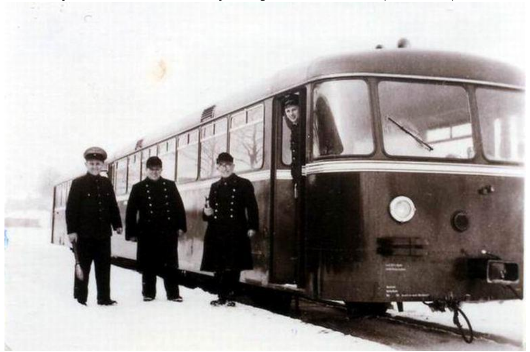
VT 95 im Bf. Neuenrade kurz nach Einführung der Schienenbusse